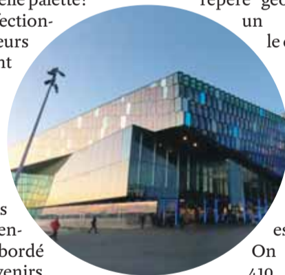
Harpa, l'opéra futuriste de la capitale.