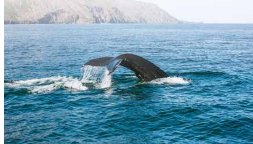
Baleine au large d'Húsavík.

L'une d'elles, encouragée par le ministre de gauche écologiste au pouvoir, a annoncé vouloir cesser toute activité en 2024, la chasse commerciale à la baleine étant globalement perçue comme l'héritage d'un monde dépassé. Ainsi, de nombreux anciens baleiniers sont désormais utilisés pour observer ou étudier les cétacés dans leur biotope. Les chances d'en apercevoir lors d'une excursion dépendent du port de départ choisi. La baleine de Minke reste la plus courante; on peut la rencontrer tout autour de l'Islande, et en toute saison.