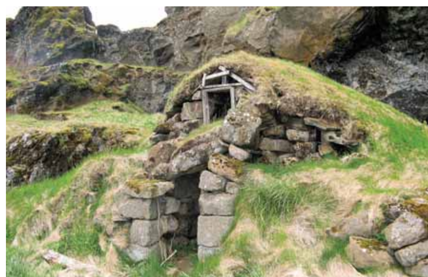
Abri rustique au milieu de nulle part.

P our les touristes qui atterrissent en Islande (aéroport international de Keflavík), la capitale - distante d'une cinquantaine de kilomètres - est un passage obligé. La majorité, toutefois, ne s'attarde guère à Reykjavik, pressés de partir à la découverte d'un territoire sauvage