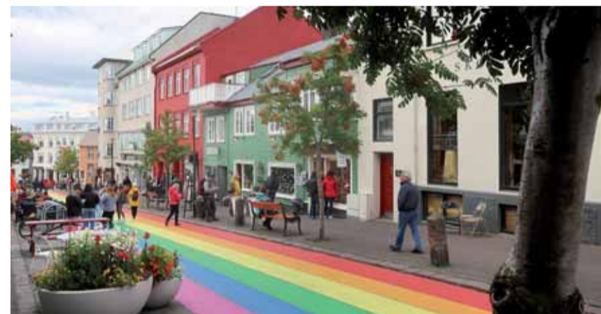
Rainbow Street, l'artère principale de Reykjavik.

Le pays de Björk connaît la chanson qui fait rêver les amateurs de grands espaces. Face à l'augmentation spectaculaire du nombre de ses visiteurs, il protège son environnement.